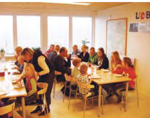
Spisning med udsigt over Kulsø