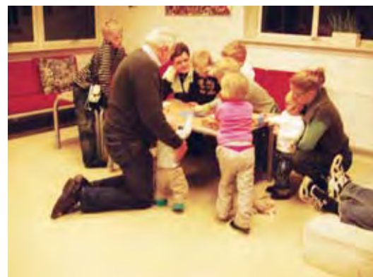
Hygge på tværs af generationer.

Her på skulle først sættes en baggrund af f.eks. sandpapir, sider fra en gammel bog, krøllet papir el.lign. Så skulle der males og til sidst pyntes med "skrot", f.eks. kobbertråde fra en ledning, ribber fra et køleskab, hegnstråd, osv. Alle var vi på bar bund, da vi startede, men ikke desto mindre blev resultaterne meget flotte og forskellige. Det var spændende at opleve, hvad man kan få ud en masse gamle ting, som ellers var på vej i skraldespanden. Igen var fællesskabet den overordnede ramme for de ikoner, som blev lavet.