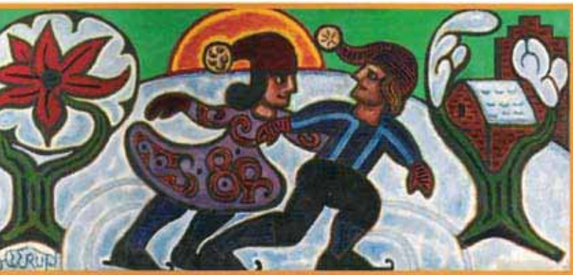
Vinter af Henry Heerup malet i 1975, som en del af udsmykningen til Koføeds Skole.

Billedet "Vinter" hænger på Koføeds Skole i København og er en del af en lang frise ved navn: "Årstidernes gang." Og netop "Vinter" spejler en gensidig forelskelse i